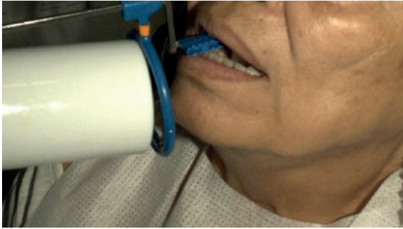
Figura 3. Uso de colimador para toma de rayos X periapicales.