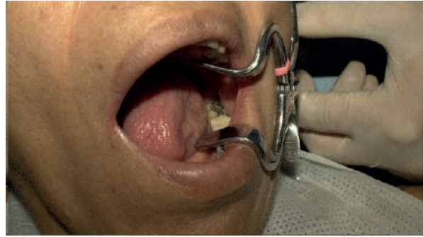
Figura 4. Colocación de abrebocas de Molt.

final y se le recomendó al cuidador su permanencia durante los futuros procedimientos.