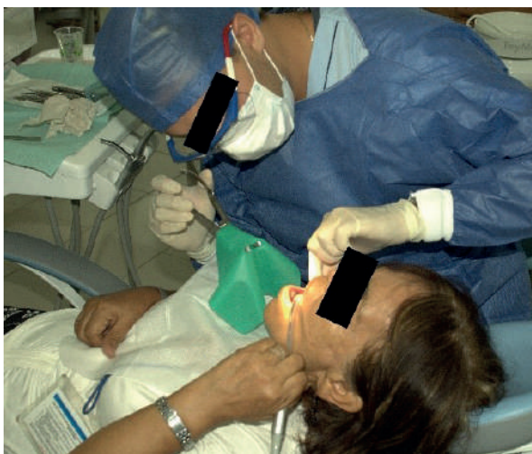
Figura 2. Colocación pausada del dique de goma en la que se puede observar la cooperación de la paciente, a quien se aprecia sosteniendo el eyector de fluidos.

Finalmente, se derivó a la paciente a la clínica de prostodoncia de la universidad para la restauración